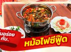
อิ่มอร่อย กับ... หม้อไฟซีฟู้ด