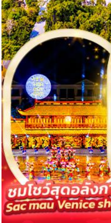
ชมโชว์สุดอลังการ Sac mau Venice show