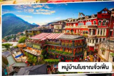
หมู่บ้านโบราณจั๋วเฟิ่น