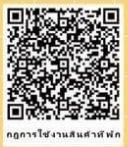
กฎการโรงแรมสำหรับนักท่องเที่ยว

ผู้เกี่ยวข้อง : โรงแรมสำหรับนักท่องเที่ยว โรงแรม โฮมสเตย์ และที่พักอื่นๆ