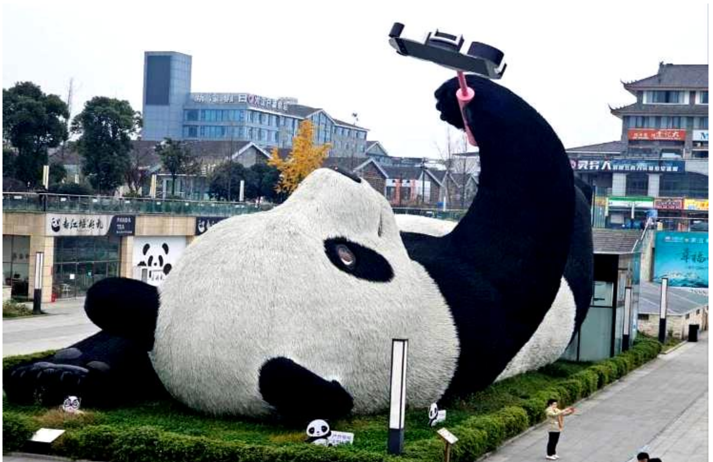
SBTTFU-SL003 เฉิงตู จิวจ้ายโกว โหมวหนี่โกว ภูเขาสี่ตรุณี (นั่งรถไฟความเร็วสูง) 6วัน 5คืน โดยสายการบิน Lion Air (SL)

จากนั้นนำท่านถ่ายกับรูปปั้นผลงานศิลปะ รูปแพนด้าถ่ายเซลฟี่ ที่ตั้งอยู่กลางจัตุรัสสุดน่ารัก ซึ่ง ออกแบบโดยนักออกแบบชื่อดัง Florentijn Hofman หมีแพนด้าตัวนี้มีความยาว 26 เมตร กว้าง 11 เมตร สูง 12 เมตรและหนัก 130 ตัน อยู่ในท่านอนหงายอยู่บนพื้น เพ้ายกขึ้นจับไม้เซลฟี่สีชมพู เล่น ถ่ายเซลฟี่อย่างสบายอารมณ์ น่ารักน่าเอ็นดูมาก นักออกแบบ Hofman แนะนำว่าผลงานแพนด้ายักษ์ โทรศัพท์มือถือขึ้นเพื่อถ่ายเซลฟี่มีความสุขมาก ด้วยท่าทางสบายๆ ผ่อนคลายและมีความสุข และ เป็นการแสดงออกด้วยภาษาทางศิลปะแบบหนึ่งที่สะท้อนชีวิตในท้องถิ่น มอบความรู้สึกสนิทสนมและ มีความสุขกับผู้ชมทุกท่าน