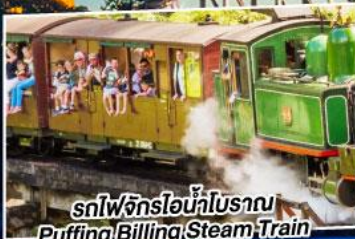
รถไฟจักรไอน้ำโบราณ Puffing Billington Steam Train