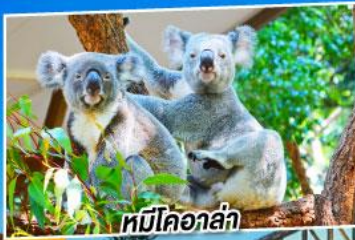
หมีโคอาล่า