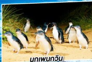
นกเพนกวิน