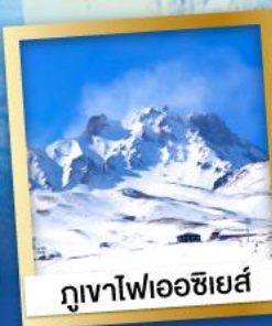
ภูเขาไฟเอซียส์