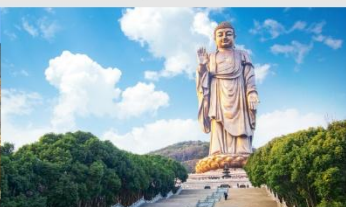
พระใหญ่หลิงชานต้าฝอ