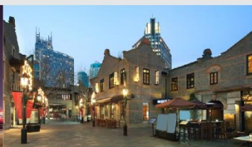
ย่านซินเทียนตี้