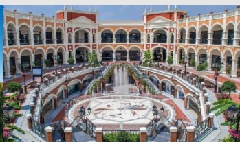
Florentia Village Outlet

*ทางบริษัทฯ ขอสงวนสิทธิ์ในการสลับโปรแกรมทัวร์ตามความเหมาะสมขึ้นอยู่กับสถานการณ์หน้างาน โดยคำนึงถึงผลประโยชน์ของลูกค้าเป็นสำคัญ