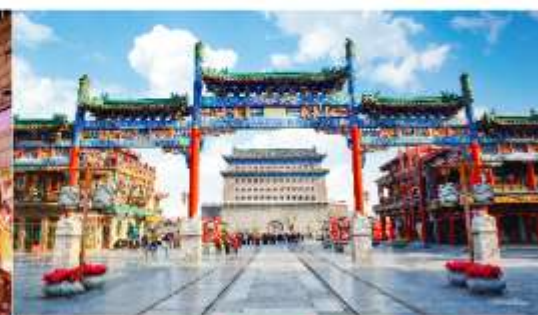
ถนนโบราณเฉียนเหมิน