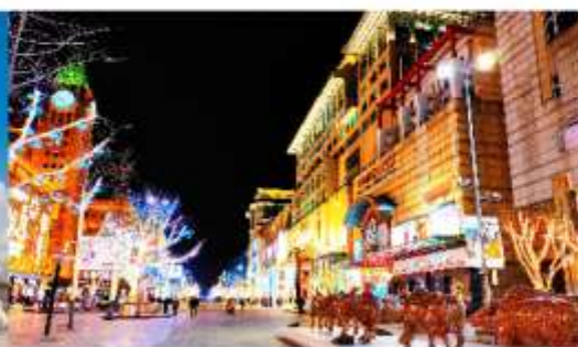
ถนนหวังฟูจิ่ง