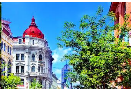
ห้างว๋านต้าสแควร์