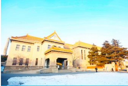
พระราชวังปวยี