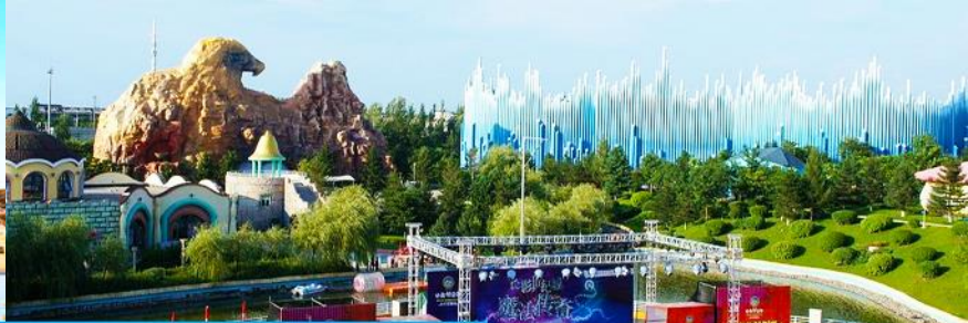
สวนสนุกธีมภาพยนตร์ ฉางชุน