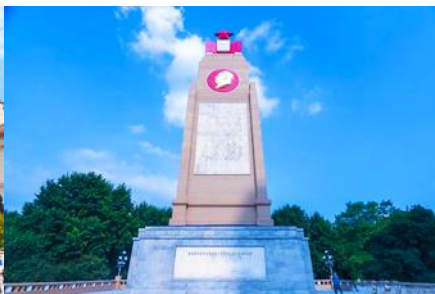
อนุสาวรีย์ฟงหวง