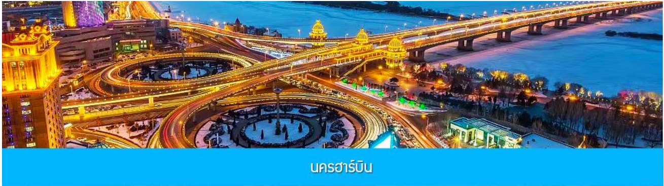
นครฮาร์บิน