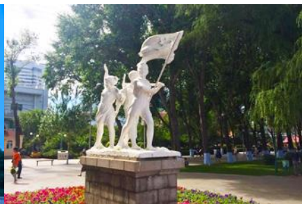
สวนสตาลิน