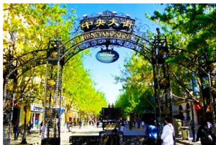
ถนนจงยงลู่