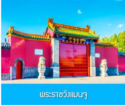
พระราชวังแมนจู