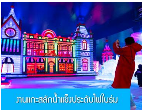
งานแกะสลักน้ำแข็งประดับไฟในร่ม