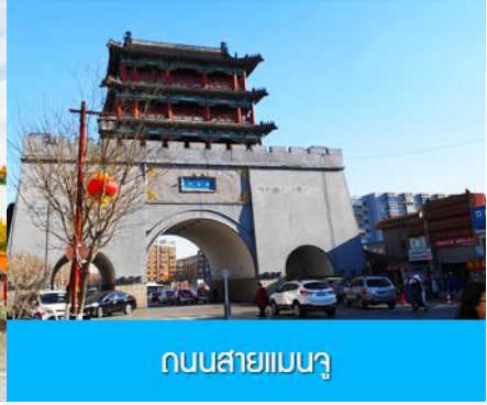
ถนนสายแมนจู