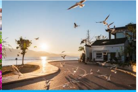
ย่านชายหาดรูป S