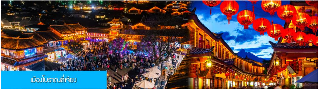
เมืองโบราณลี่เจียง