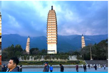
เจดีย์สามองค์