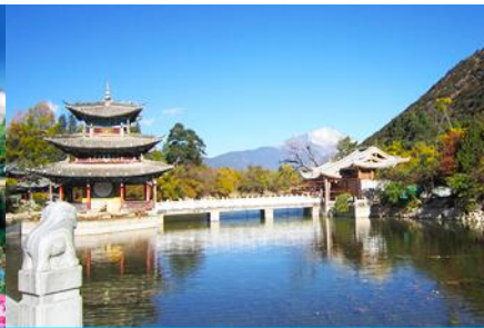
สระน้ำมังกรดำ