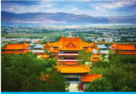
เมืองต้าหลี่