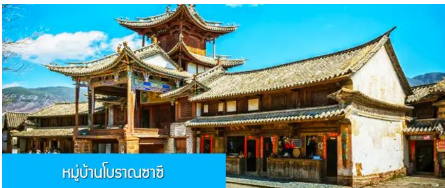
หมู่บ้านโบราณซาซี