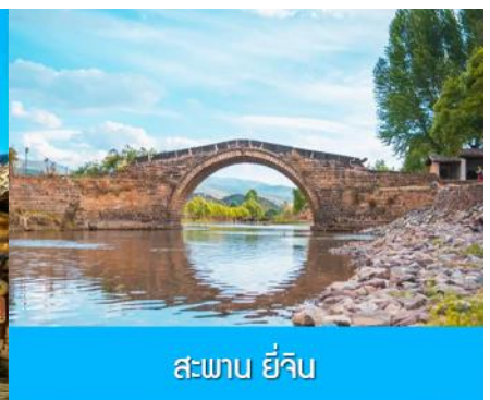
สะพาน ยี่จิน