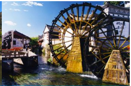
เมืองโบราณลี่เจียง