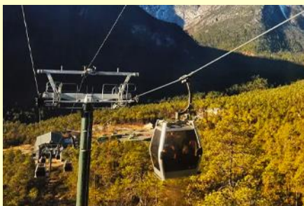
นั่งกระเช้าสถานี หยุนชานผิง

หรือท่านสามารถเลือกซื้อโปรแกรมเสริม OPTIONAL TOUR แพคเกจท่องเที่ยวภูเขาหิมะมังกรหยกแบบครึ่งวัน อัตราค่าบริการท่านละ 3,500 บาท ในอัตราค่าบริการรวมรายการดังนี้