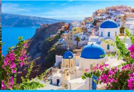
ย่านซานโตรินี่