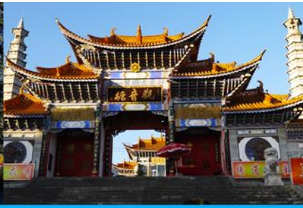
วัดเจ้าแม่กวนอิมเปलगาย