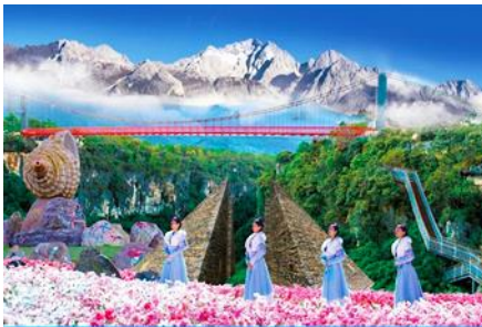
Snow Mountain Canyon Park

พักที่ LIJIANG FENGHUANG HOTEL โรงแรมระดับ 4 ดาวท้องถิ่น หรือเทียบเท่าในเมืองลี่เจียง