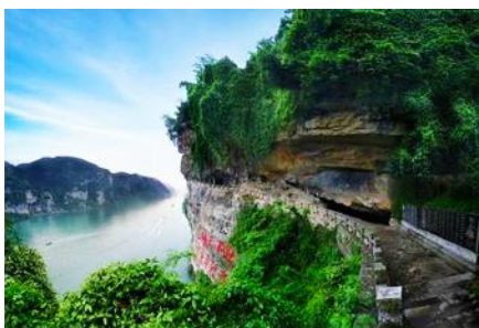
สวนกำสามสหาย