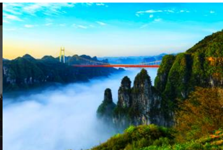
อุทยานป่าไผ่แห่งชาติไฉ่จ้าย