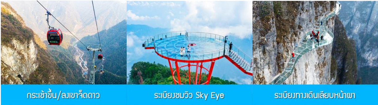
กระเช้าขึ้น/ลงเขาเจ็ดดาว

พักที่ ZHENMIN HOTEL โรงแรมระดับ 4 ดาวหรือเทียบเท่า