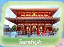
วัดอาซากุสะ

เที่ยวครั้งเดียวเที่ยวครบสองเมืองหลักญี่ปุ่น บอพรที่วัดอาซากุสะ ขึ้นภูเขาไฟฟูจิชั้นที่ 5 ซุปปังย่างชิบุงุ เชคอินฟาร์มแกะจิวภูเขาไฟฟูจิ วนน้ำใสคิโยมิสุเดระ ศาลเจ้าฟุชิมิ อินาริ เชคอินแลนด์มาร์คปราสาทโอซาก้า