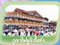
ภูเขาไฟฟูจิ 5 แห่ง

✈️ สายการบิน AirAsia X (XJ) น้ำหนักกระเป๋า 20 KG