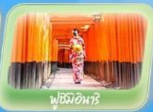
ฟูชิมิอินาริ