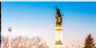
อนุสาวรีย์ฟิ่งหง