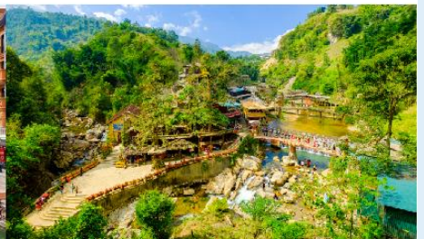
หมู่บ้านก๊อต ก๊อต

*ทางบริษัทฯ ขอสงวนสิทธิ์ในการสลับโปรแกรมทัวร์ตามความเหมาะสมขึ้นอยู่กับสถานการณ์หน้างาน โดยคำนึงถึงผลประโยชน์ของลูกค้าเป็นสำคัญ