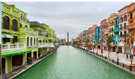
เมก้าแกรนด์เวิลด์ฮานอย