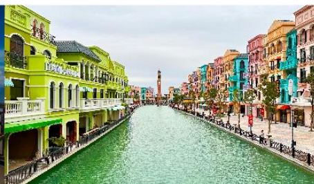
เมก้าแกรนด์เวิลด์ฮานอย

*ทางบริษัทฯ ขอสงวนสิทธิ์ในการสลับโปรแกรมทัวร์ตามความเหมาะสมขึ้นอยู่กับสถานการณ์หน้างาน โดยคำนึงถึงผลประโยชน์ของลูกค้าเป็นสำคัญ