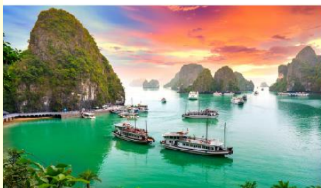
ล่องเรือชมอ่าวฮาลอง