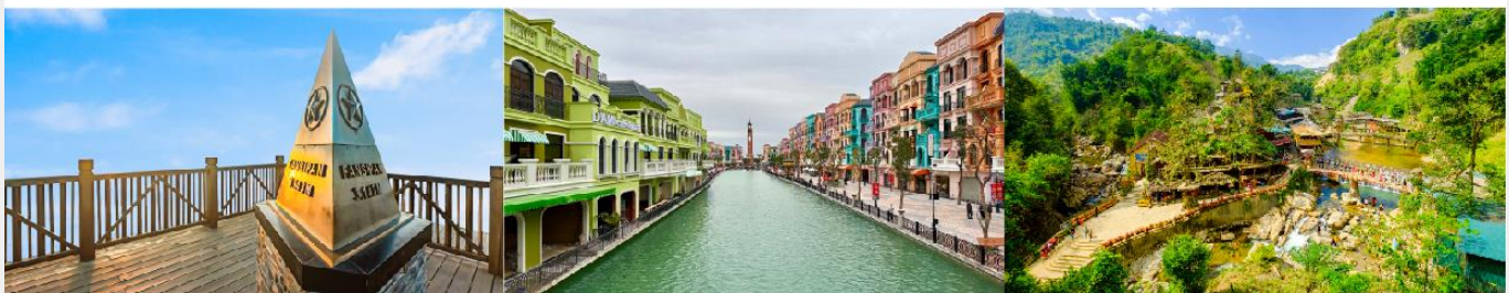
ยอดเขาฟานซิปัน