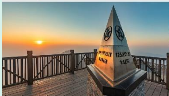
ฟานซิปัน