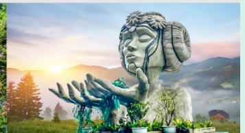
โมอาน่าคาเฟ่

*ทางบริษัทฯ ขอสงวนสิทธิ์ในการสลับโปรแกรมทัวร์ตามความเหมาะสมขึ้นอยู่กับสถานการณ์หน้างาน โดยคำนึงถึงผลประโยชน์ของลูกค้าเป็นสำคัญ