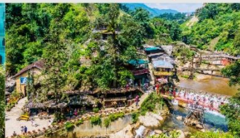
หมู่บ้านก๊ต ก๊ต