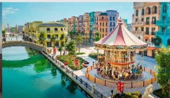
Mega Grand World