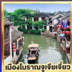
เมืองโบราณจูเจียเจี่ยว