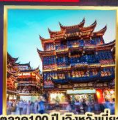
ตลาด 100 ปี เิงหวิงเมี่ยว