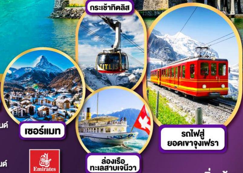
กระเช้ากิตลิส