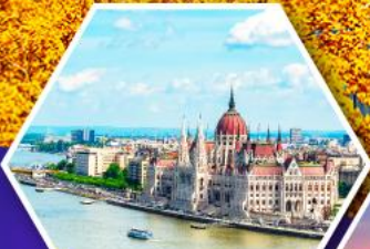
แม่น้ำดานูบ