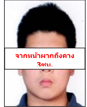
จากหน้าผากถึงคาง 3 ซม.

ทั้ง 2 ข้าง, ห้ามตกแต่งรูป, รูปไม่เลอะหมึก ไม่มีรอยแม็ก, ถ่ายจากร้านถ่ายรูปเท่านั้น