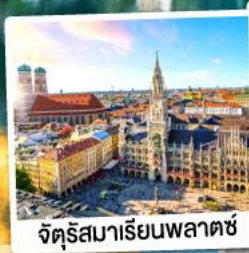
จตุรัสมาเรียนพลาตซ์

15-21 ต.ค. 67 28 ก.พ.-06 มี.ค. / 12-18 มี.ค. 68 28 มี.ค.-03 เม.ย. / 03-09, 10-16 เม.ย. 68 25 เม.ย.-01 พ.ค. / 29 เม.ย.-05 พ.ค. 68