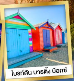
โบรด์ตัน บาร์ตัง บ็อกซ์