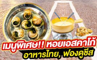
เมนูพิเศษ!! หอยเอสคาโก้ อาหารไทย, พองดูซีส