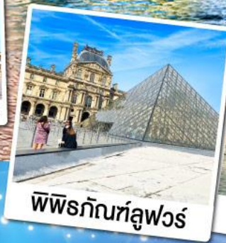
พิพิธภัณฑ์ลูฟวร์