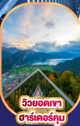
วิวยอดเขา ฮาร์เตอร์คুম