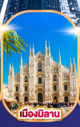
เมืองมิลาน