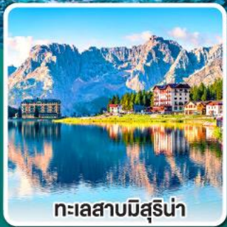
ทะเลสาบมิสุรีน่า

เข้าชมมหาวิหารเซนต์ปีเตอร์ ที่ใหญ่ที่สุดในโลกแห่งนครวาติกัน