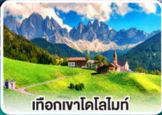
เทือกเขาโดโลไมท์