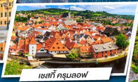
เซสท์ ครุมลอฟ