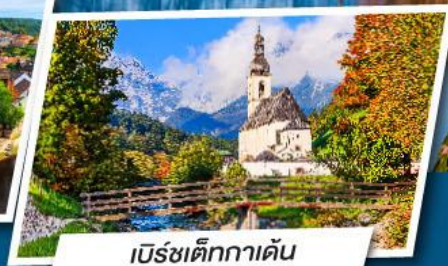
เบียร์เท็กกาเดิน