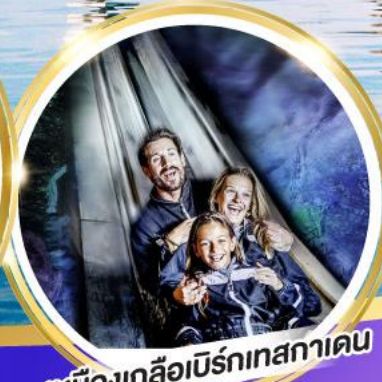
เหมืองเกลือเบิร์กเทสกาเดิน