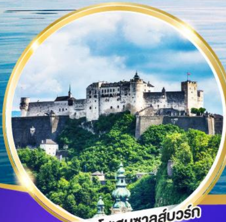
ปราสาทไฮอนชาลส์บวร์ก