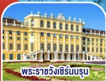
พระราชวังเชรินบรุน