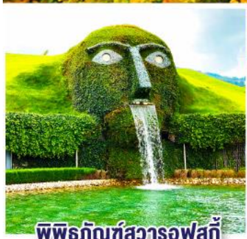
พิพิธภัณฑสถานสวิสเซอร์แลนด์