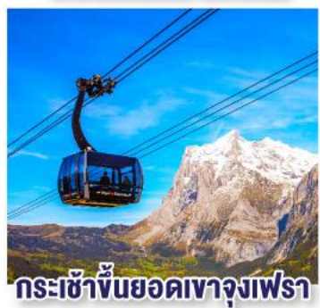
กระเช้าขึ้นยอดเขาจุงเฟรา