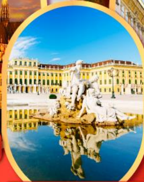
พระราชวังซินบรูนน์