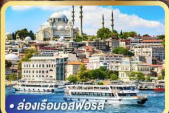
• ส่องเรือบอสฟอรัส