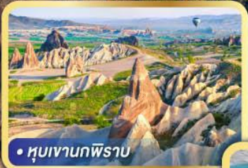
• หุบเขานกฟิรา