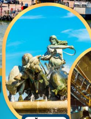
น้ำพุแห่งราชินีเทฟิออน