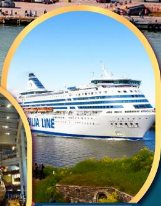
เรือสำราญ TALLINK SILJA LINE