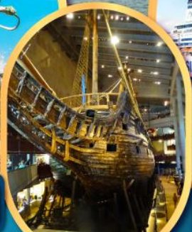
พิพิธภัณฑ์เรือวาซา