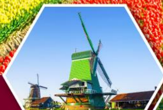
หมู่บ้านกังหันลม ซานส์คินส์