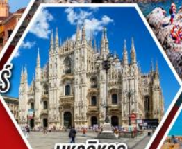
มหาวิหาร ดูโอโมแห่งมิลาน