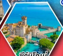
ซิมิโอนี

• อกุยานโดโลไมท์ • นั่งกระเช้าสู่ยอดเขาแอลปี ดิซุสซาซี • ดินแดนห้าหมู่บ้านชิงเควเทอร์ส