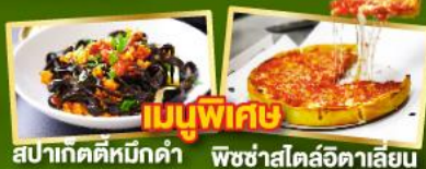
เมนูพิเศษ สปาเก็ตตี้หมักดำ พิชซ่าสโตร์อิตาลีเลียน