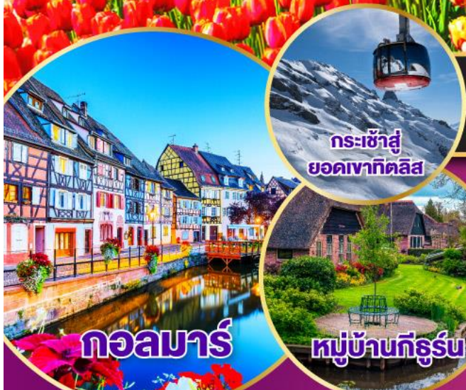
กระเช้าสู่ ยอดเขาทิลิส

19-28 มี.ค.68 / 01-10, 12-21, 14-23 เม.ย.68 03-12, 04-13, 05-14 พ.ค.68