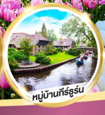
หมู่บ้านกัร์ธูร์น