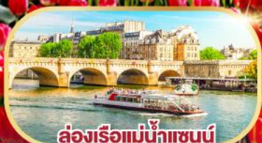
ล่องเรือแม่น้ำแซนน์