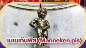
แมนกันพีส (Manneken pis)