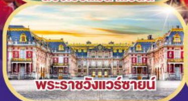
พระราชวังแวร์ซายน์