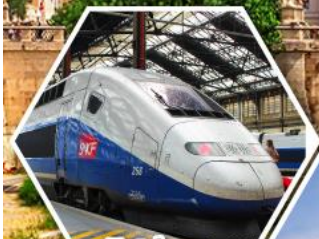
รถไฟความเร็วสูง TGV

พิเศษ!! ราคานี้รวมล่องเรือคอนโดล่า บนเกาะเวนิส