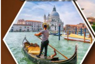
ล่องเรือคอนโดล่า บนเกาะเวนิส