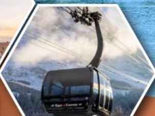
กระเช้าขึ้นสู่ยอดเขาจุงเฟรา

พิเศษ!! ล่องเรือคอนโดล่า บนเกาะเวนิส ราคาเริ่มต้น