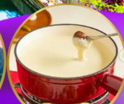
ฟองดูชีส