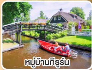
หมู่บ้านกิธูร์น