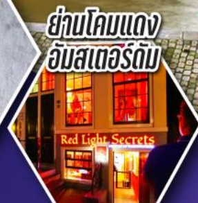
ย่านโคมแดง อัมสเตอร์ดัม

ตะลุยอัมสเตอร์ดัม ทั่วจัตุรัสดามสแควร์ และย่านโคมแดง (Red Light)