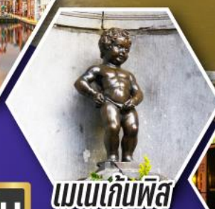
เมเนเก็มพิส