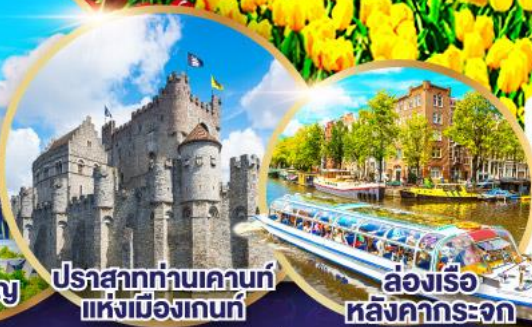
ปราสาทท่านเคานท์แห่งเมืองกันท์