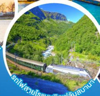
รถไฟสายโรแมนติกฟลัมสบานา