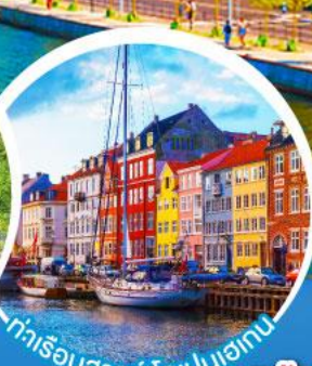
ท่าเรือฮาวน์.โคเปนเฮเกน