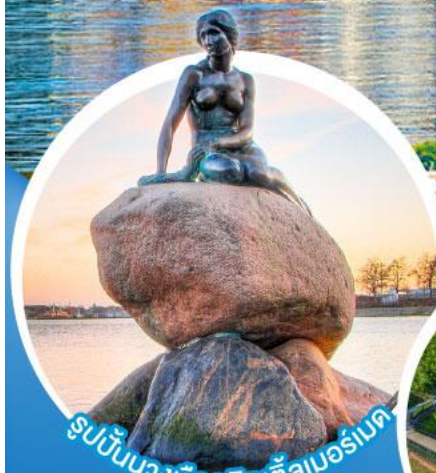
รูปปั้นนางเงือกลิตเติลเมอร์เมด