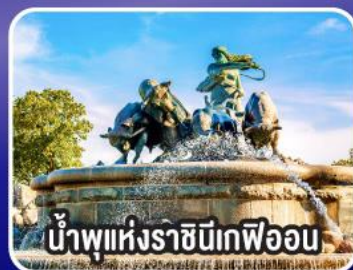
น้ำพุแห่งราชินีเทเฟออน