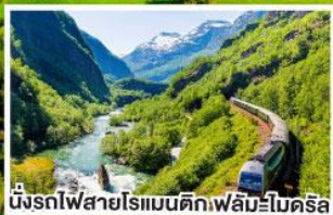
นั่งรถไฟสายโรเมนติกฟิล์มโบเดริส