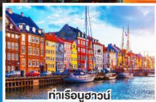
ท่าเรือฮาวน์