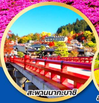
สะพานนาคะบาชิ