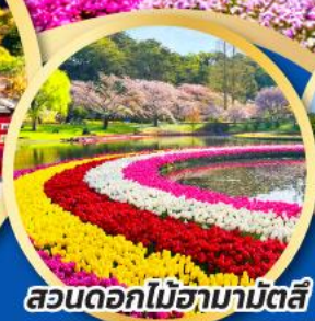
สวนดอกไม้ฮามามิตสึ