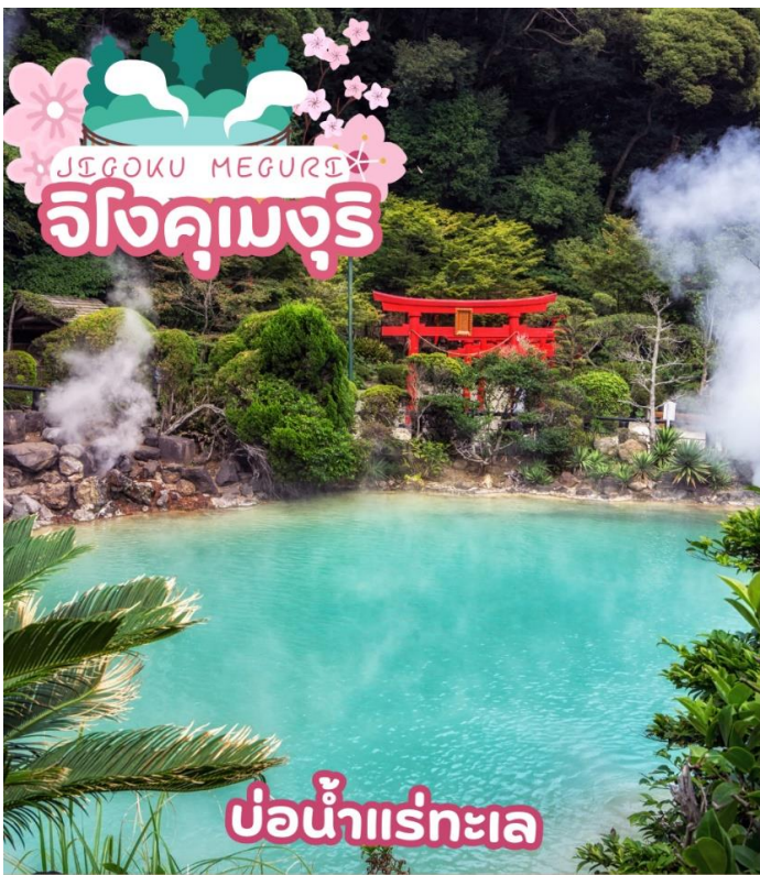
บ่อน้ำแร่ทะเล

ชม จิโวกุเมกุริ (JIGOKU MEGURI) ซึ่งประกอบไปด้วยบ่อน้ำแร่สีส้มแปลกตาทั้งหมด 8 บ่อ (ไกด์จะพาท่านเยี่ยมชมชม 2 บ่อ) ที่เกิดจากการรังสรรค์ขึ้นโดยธรรมชาติแต่ละบ่อมีความร้อนสูงเกินกว่า 100 องศาเซลเซียส ด้วยสีส้มและความร้อนชนิดที่มนุษย์ธรรมดาไม่อาจลงไปสัมผัสได้ จึงถูกกล่าวขานว่าเป็นเสมือน “บ่อน้ำแร่รุกรก” ดังนั้น ที่นี่จึงมีตัวมาสคอตเป็นยมทูตน้อยคอยให้การต้อนรับทุกคนที่มาเยือน