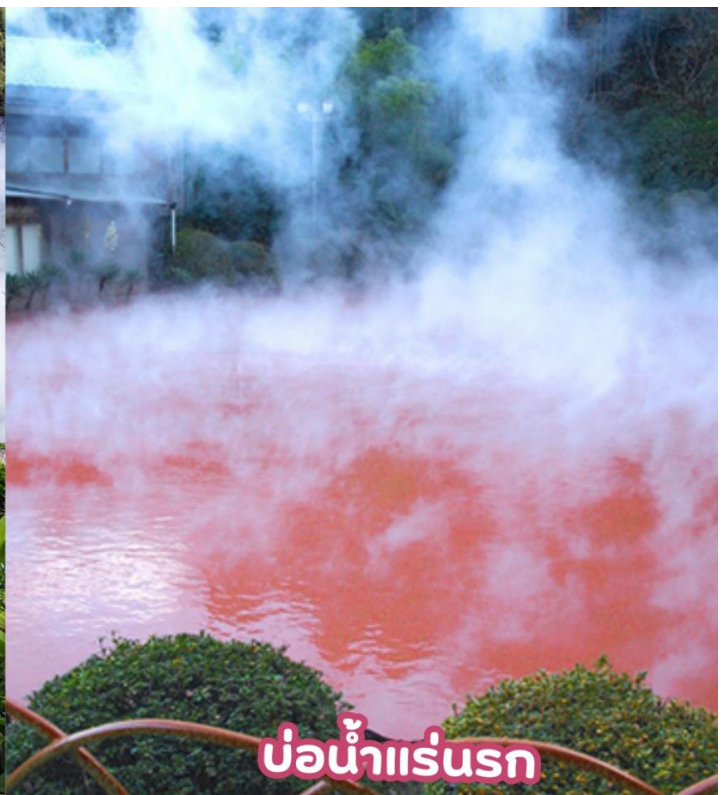
บ่อน้ำแร่รุกรก

หมู่บ้านยูฟูอิน (YUFUIN FLORAL VILLAGE) เป็นหมู่บ้านเล็กๆที่อยู่ในจังหวัดโออิตะห่างจากเมืองบ่อน้ำร้อนเบปปุประมาณ 10 กิโลเมตร หมู่บ้านแห่งนี้เป็นหมู่บ้านหัตถกรรม และยังเป็นที่ยังคงแบบบ้านต่างๆในประเทศญี่ปุ่นที่มีอายุตั้งแต่ 120-180 ปีมารวมไว้ที่นี่อีกด้วย ที่นี่จึงจัดได้ว่าเป็นพิพิธภัณฑ์ที่มีชีวิตที่สามารถดึงดูดนักท่องเที่ยวให้เดินทางมาเยี่ยมชมได้ตลอดทั้งปี จากนั้นพบความงามของ ทะเลสาบคิริน (Kirin Lake) น้ำทะเลสาบใสเห็นตัวปลาแหวกว่ายในผืนน้ำ บางช่วงมีหมอกบางๆ ลง นับว่าคุ้มค่ากับการมาเห็นความงามนี้ด้วยตาตัวเองสักครั้งนี้อย่างแน่นอน อิสระให้ท่านเดินเล่นและถ่ายรูปตามอัธยาศัย