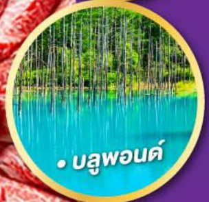
• บลูพอนด์