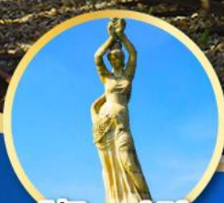
ภูเก็ต เซอร์เกิร์ล