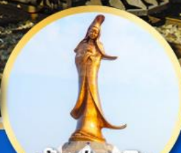
เจ้าแม่กวนอิม ริมทะเลมาเก๊า