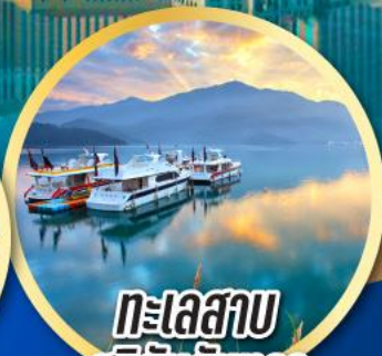
ทะเลสาบ สุริยันจันทรา